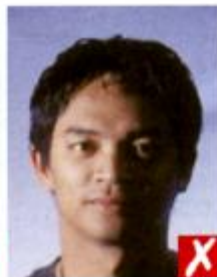
Тени поперек лица