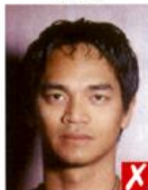
Тени позади головы