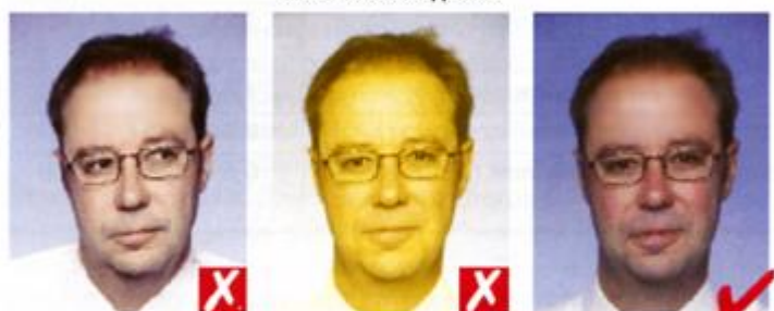
Смотрит в сторону