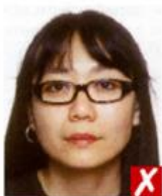
Оправа слишком толстая