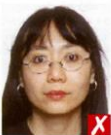
Оправа закрывает глаза