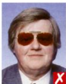
Темные окрашенные линзы