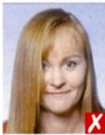
Волосы поперек глаз