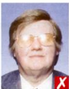
Отражение вспышки на линзах