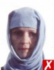
Тень поперек лица