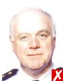
Отражение вспышки на коже