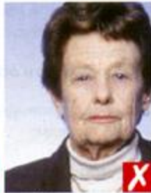
Не по центру