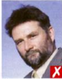
Глаза под наклоном